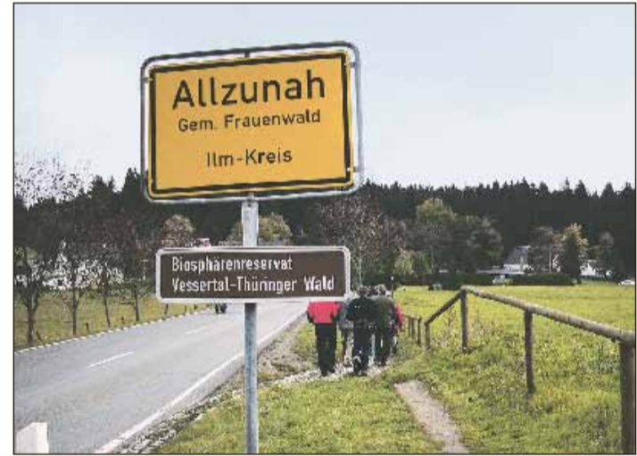
Das Biosphärenreservat Vessertal-Thüringer Wald wurde 1979 von der UNESCO international anerkannt und ist eines der beiden ältesten deutschen Biosphärenreservate.