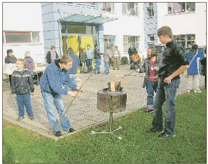
Bei Bratwürsten und Getränken wurde beim ersten Tischtennisturnier am neuen Platz den Sportlern lautstark eingeleitet.