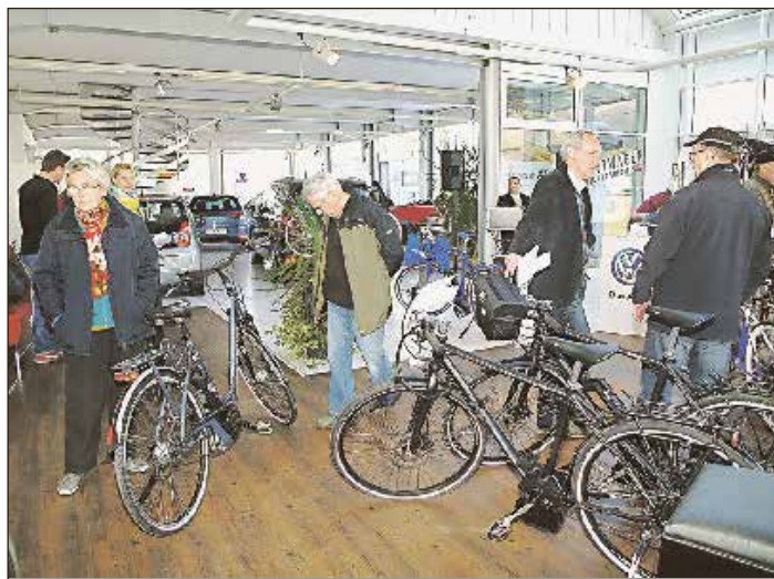
elektro unterstützten Fahrradfahrens zu erläutern. Viele nutzten die Möglichkeit, mit den unterschiedlichsten E-Bikes mal eine Runde Probe zu fahren, um so den besonderen Fahrspaß zu erleben. Also, freuen Sie sich schon mal auf die kommende Radsaison. Mit einem E-Bike erleben Sie uneingeschränktes Vorankommen - selbst bei körperlichen Beeinträchtigungen.