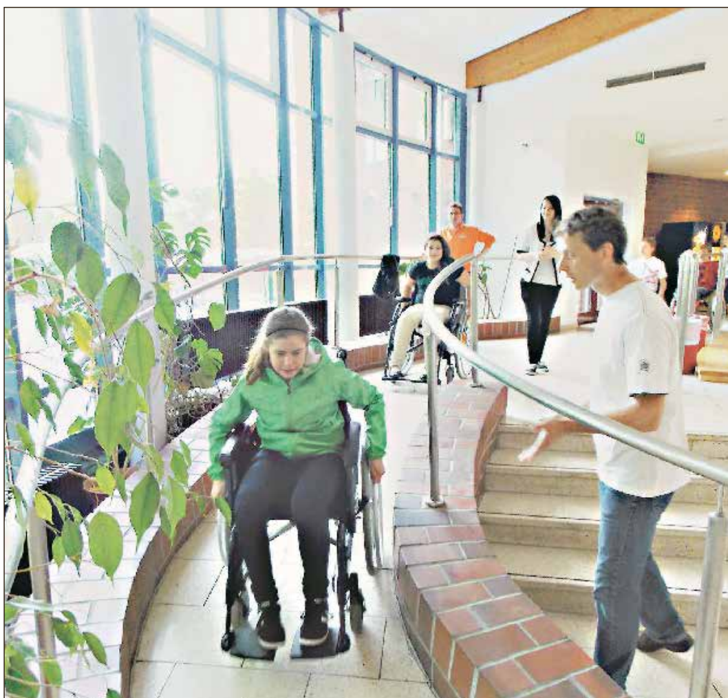
Dass Menschen verschieden sind, konnten die Schüler der 7. Klassen des Gymnasium Georgianum in der vergangenen Projektwoche zum Thema „Menschen sind verschieden“ sehr praktisch am eigenen Leib erfahren und lernen, aus welcher Perspektive z.B. behinderte Menschen ihre Welt sehen.