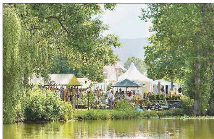
Das wunderbare Flair der „Haus & GartenTräume“ auf der Burg Ohrdruf zieht wieder viele Besucher an.

er, Brotbacken auf indianische Art, ein Slackline-Parcours und ein Kanu-Workshop stehen für alle Mutigen bereit. Als besonderen Service bietet „Pflanzendoktor“ und Gärtnermeister Pascal Klenart in seiner täglichen Sprechstunde Hilfe für die Besitzer kränkelder Gewächse. Anhand von Teilen oder Bildern der Sorgenkinder empfiehlt er Therapien gegen Blattlaus & Co. In zahlreichen Expertenvorträgen erfahren Gäste zudem spannende Details, etwa wie sich der Garten in sieben Schritten zum pflegeleichten Kleinod umgestalten lässt oder wie sie die natürliche Wasserzufuhr verbessern und mit möglichst wenig Gießen auskommen. Das Gartenfest „Haus & GartenTräume“ hat am Freitag und Samstag jeweils von 10 bis 19 Uhr, am Sonntag bis 18 Uhr geöffnet. Der Eintritt beträgt 8 Euro für eine Tageskarte; Schüler, Studenten und Schwerbehinderte zahlen einen ermäßigten Preis von 6 Euro; Kinder bis einschließlich 12 Jahren genießen in Begleitung Erwachsener freien Eintritt. Die Kasse schließt jeweils eine halbe Stunde vor Ausstellungsende. Die Konzerte sind für Tageskarteninhaber Teil des kostenfreien Rahmenprogramms. Abendkassengäste zahlen bei Einlass ab 18.30 Uhr 12 Euro (Seldom Sober Company) bzw. 15 Euro (Acoustic Revolution). Alle Detail-Informationen sowie das komplette Programm unter: www.gartenkönig.com