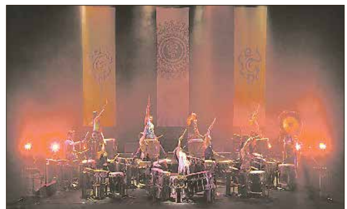
Die Band „Gocoo“ bietet im Stadttheater eine einzigartige Show.