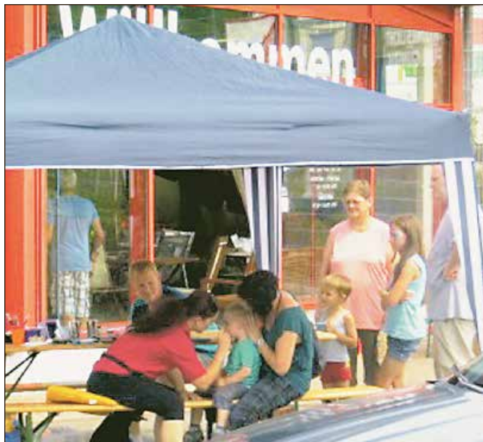
und trotz tropischer Temperaturen wieder den Weg zu ihrem hagebau. Es wurde für alle etwas geboten, vom Kinderschminken über Hüpfburg und Ballonwettbewerb bis zum Parkplatzroulette mit tollen Preisen. Den Hauptgewinn, ein