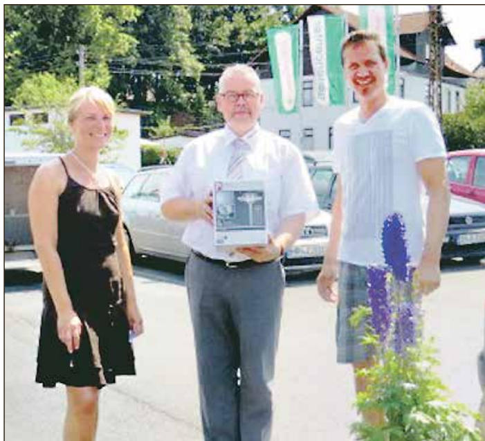
Anzeige: Hildburghausen. Zum verkaufsoffenen Sonntag, am 28. Juli 2013 fand ein großes Sommerfest zum 20-jährigen Jubiläum des hagebaumarktes in Hildburghausen statt. Zahlreiche Besucher fanden bei strahlendem Sonnenschein