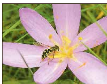
Trockene oder nasse „Füße“ holt sich der Wanderer rund um Breitenbach.