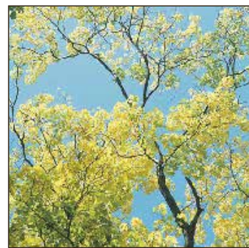
Zeugen der Geschichte - alte Bäume rund um Schmiedefeld.

In der Wärme der Sonne, nach gewittiger Nacht, ist die Schönheit der Natur nun wieder erwacht.