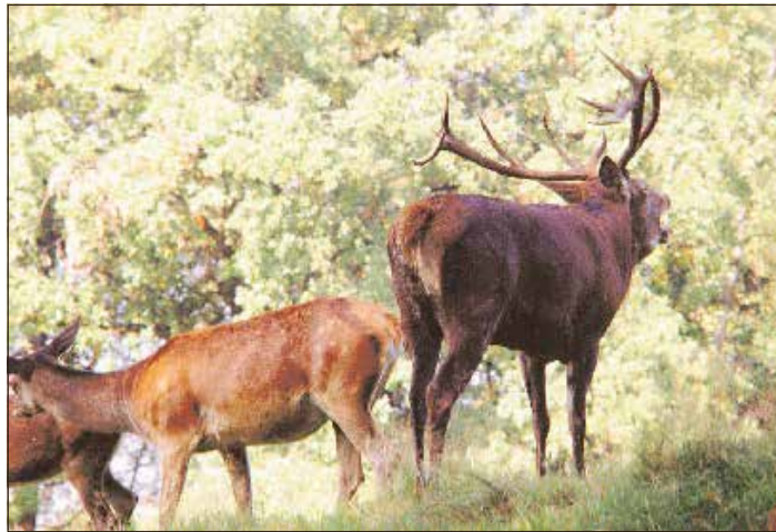
„Imponiergehabe“ eines Rotwild-Hirsches bei der Brunft.

Mit Beginn des Herbstes sind Wildtiere aktiver als sonst: Holzeinschlag, Maisernte auf den Feldern und die Paarungszeit des Rotwildes sind nur einige Gründe. Auf den Straßen sollten Autofahrer die Geschwindigkeit drosseln, weil in der Zeit der Hirschbrunft unversehrt Tiere die Straße queren können. In den Tagen der Brunft zieht es viele naturverbundene Menschen in die Wälder, um den Hirsch als König des Thüringer Waldes „Röhren zu hören“. Die Kreisjägerschaft Hildburghausen bittet Spaziergänger, Pilzsammler, Jogger, Reiter und andere Naturfreunde, Warnhinweise zu beachten. Die Hirsche streifen wie besaust durch das Dickicht der Reviere, nehmen kaum noch Nahrung auf und vergessen alle Vorsicht. Eine besondere Gefahr für Kraftfahrer in den waldreichen