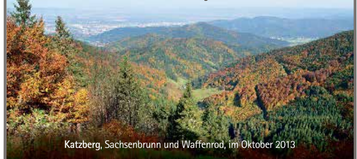
Katzberg, Sachsenbrunn und Waffenrod, im Oktober 2013

Der Trauergottesdienst findet am Samstag, dem 26. Oktober 2013, um 11.00 Uhr in der Johanniskirche zu Schalkau mit anschließender Urnenbeisetzung auf dem Friedhof in Katzberg statt.