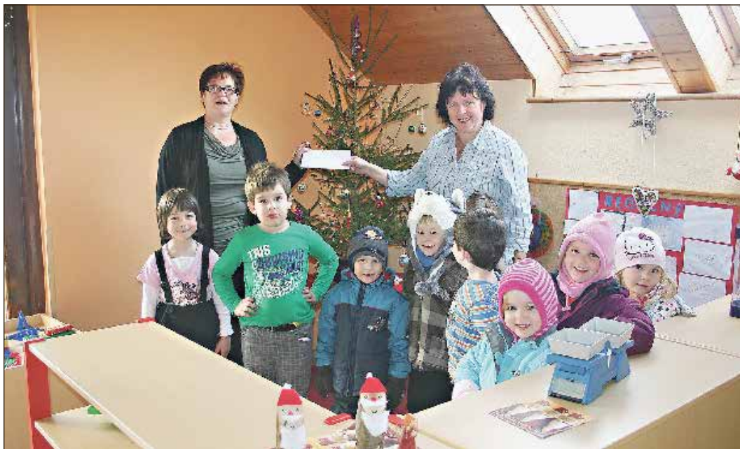
Der Lions Club Eisfeld spendete am Nikolaustag den Kindern in Sachsenbrunn, Harras und Eisfeld.

Eisfeld. Auch im Jahr 2013 hat der Lions Club Eisfeld wieder den Nikolaustag genutzt, um den Kindergärten in Eisfeld, Sachsenbrunn und Harras einen Besuch abzustatten. Diese nun schon seit vielen Jahren gepflegte Tradition unseres Clubs liegt allen Mitgliedern am Herzen.