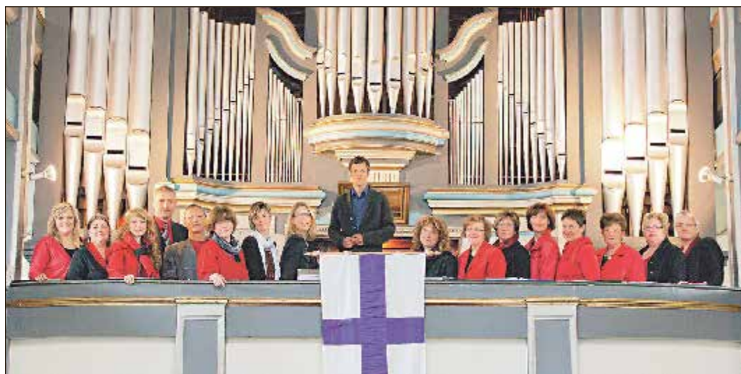
Der Gospelchor der Kirchgemeinde Ohrdruf.

Die Kirchgemeinden Pfersdorf und Milz laden dazu ganz herzlich ein: am Samstag, dem 6. September 2014 um 19 Uhr zum Konzert in die Nikolai Kirche Pfersdorf und am Sonntag, dem 7. September 2014 um 17 Uhr in die Magdalenenkirche Milz. Der Eintritt ist frei, um Kollekte wird gebeten.