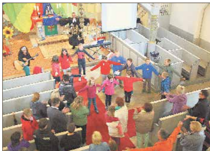
Die Kirche in Brünn wurde entsprechend dem Anlass liebevoll mit vielen kleinen Schultüten, Luftballons und vielem mehr geschmückt.