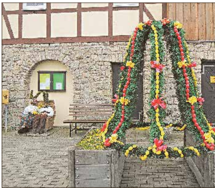
Festlich geschmückt sind der Dorfbrunnen und der Dorfplatz in Birkenfeld.

Leckereien aus dem Backhaus, Herzhaftes vom Grill und die verschiedensten durstlöschenden Getränke der ältesten Brauerei des Thüringer Waldes erwarten Sie als unsere Teilnehmer und herzlich willkommenen Gäste.