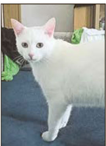
Dieser sehr schöne weiße Kater sucht ein neues Zuhause.

Hildburghausen. Ein wunderschöner weisser Kater sucht ein neues Zuhause, in dem er die Alleinherrschaft hat. Er ist 1 Jahr alt, stubenrein, kastriert, sehr verschmust und kinderlieb und kennt bisher nur die Wohnungshaltung. Er muss leider aus gesundheitlichen Gründen abgegeben werden. Bitte nur als Einzeltier, alle Versuche mit Artgenossen sind gescheitert. Wer dem Kater ein neues liebevolles Zuhause schenken möchte, meldet sich bitte beim Tierschutzverein Hildburghausen, unter Tel. 0160/ 6494685.