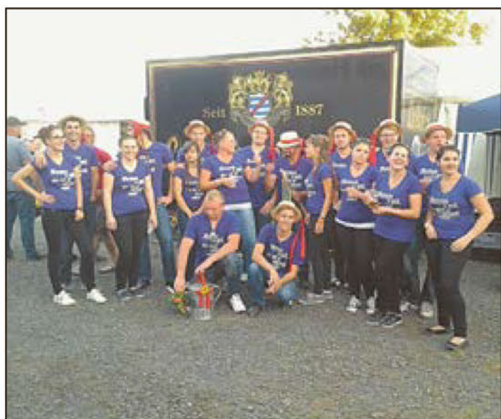
Nach langer Pause fanden sich in Hellingen wieder Jugendliche, die zu einer zünftigen Kirmes einluden.