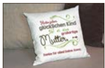
Kuschelkissen mit persönlicher Widmung sind ein Blickfang.

ten mit humorvollen Botschaften werden vom reinen Schmutzfänger zum freundlichen Gruß vor der Haustür.