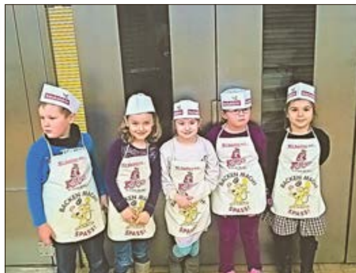
Die „Lernkinder“ des Kindergartens Hellingen in der „Weihnachtsbäckerei“ Kaiser.