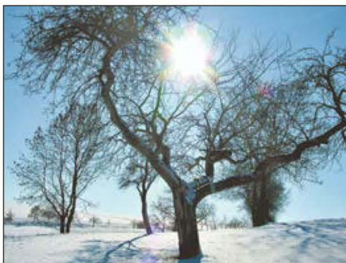
Der Kontrast von Schnee und Sonne gibt immer wieder ein schönes Motiv her. Selbst im Winter kann die Sonne viel Licht und Wärme spenden. Dies scheint auch dieser Apfelbaum in Hildburghausen zu genießen. Text + Foto: Ute Ebert

Um das kleine Schneeflöckchen berühren zu können, streckte er seine Hand zum Fenster. Vorsichtig fasste der kranke Junge an die Scheibe und legte seine Hand auf den Stern aus Schneeflocken. Für ein paar Augenblicke konnte er das kleine Schneeflöckchen ganz nah spüren. Und als er seine Hand wieder wegnahm, hatten sich die Flocken plötzlich zu einem Herz geformt. Sie änderten ständig ihre Form und erfreuten den kranken Jungen mit immer neuen Bildern. Lachend spielte der kranke Junge mit den Schneeflocken an seinem Fenster. Am nächsten Tag war Weihnachten und er würde weiter aus dem Fenster schauen, um die Schneeflocken zu beobachten und gesund zu werden, denn morgen war ja Heiligabend.