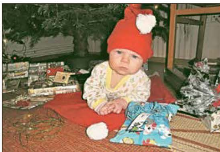
Sina's erstes Weihnachtsfest in Pfersdorf 2014 mit knapp vier Monaten. Text + Foto: Michaela Schneider

Beim Kauf von Geschenken für Hunde warnt der Deutsche Tierschutzbund vor nicht artgerechten Spielzeugen, die oftmals Verletzungsgefahren bergen. Zu kleine Spielzeuge oder die Innenteile von quietschenen Gegenständen könnten im Eifer des Spiels schnell verschluckt werden oder beim Kauen zersplittern. Zum Schutz der Vierbeiner sollte man auch darauf verzichten, zu viele zusätzliche Leckereien - und schon gar nicht von den Weihnachtstellern oder der Festtafel - zu verfüttern. In vielen Fällen führt es zu Verdauungsstörungen, die dann schnell beim tierärztlichen Notdienst eintreten können. Das größte Geschenk aber, das Hundehalter ihren Lieblingen machen können, ist Aufmerksamkeit und die artgerechte Beschäftigung mit ihren Tieren. So kann zum Beispiel ein ausgedehnter Spaziergang sowohl für den Zwei- als auch für den Vierbeiner zu einem Höhepunkt der Feiertage werden.