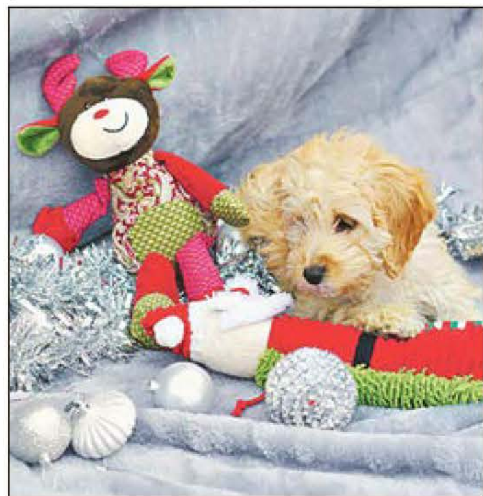
Auch wenn es dem Hund egal ist, ob Weihnachten ist, über Geschenke freuen sich auch Vierbeiner.