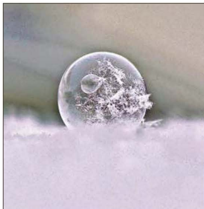
Eine Seifenblase gehüllt in Schnee und Eis - zauberhaft und einzigartig. Glückwunsch an die Fotografin für dieses einzigartige Foto.

Welch riesengroße Wiedersehensfreude, Welch tief empfundene Dankbarkeit, nach fast fünf Jahren das Weihnachtsfest wieder gemeinsam feiern zu können! 1946 waren wir voller Optimismus - wir hatten die Hoffnung, daß Gefangene und Vermißte bald zurückkehren würden (der Mann meiner Schwester blieb verschollen), daß jeder von uns bald wieder eine eigene Woh-