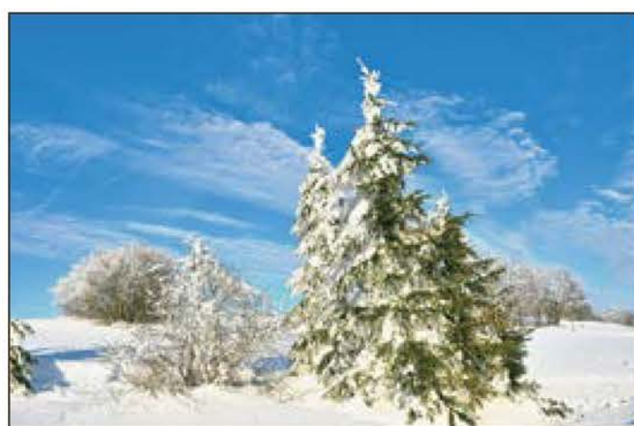
„Winterzauberwald“ - Aufnahme Anfang 2015 in Masserberg.

Gegen 7.45 Uhr sollte ein Zug nach Lüneburg eingesetzt werden, aber auf einmal entstand Unruhe auf dem Bahnhof - die Folge einer lauten Durchsage, der Bahnsteig solle geräumt werden. Plötzlich flammte die Beleuchtung auf, Militärpolizei erschien und sperrte den Bahnsteig ab. Gleich darauf erschienen englische Offiziere mit ihren Familien und bestiegen einen gerade eingefahrenen Zug. Auch sie wollten zu Weihnachten in ihre Heimat. Kaum hatte der Zug den Bahnhof verlassen, flutete die Woge wartender Menschen wieder auf den Bahnsteig zurück.