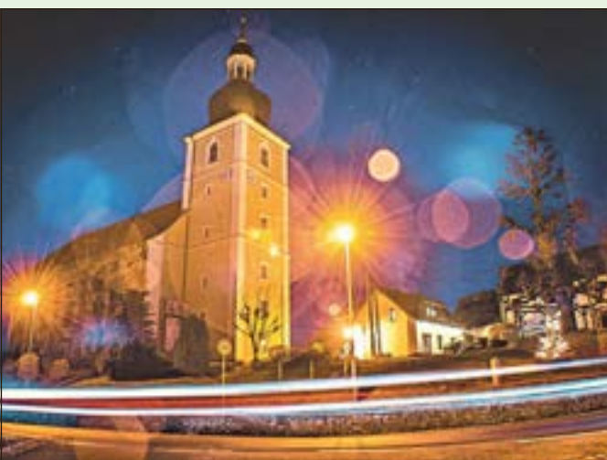
Marienkirche im Winterzauber

Eishausen. Der Förderverein Kirche Eishausen e. V. lädt ganz herzlich zum Weihnachtskonzert mit der Folkloregruppe Breitenbach am Samstag, dem 3. Dezember 2016, um 16 Uhr in die Marienkirche Eishausen ein. Der Eintritt ist frei, über eine Spende für die Kirchensanierung würden wir uns natürlich freuen. Es gibt Bratwürste, Steak und Currywurst sowie Glühwein zum Aufwärmen. Auch unsere Tombola haben wir wieder für euch vorbereitet - jedes Los gewinnt! Wer gerne Sachspenden für die Tombola abgeben möchte, kann dies am 21. November 2016, von 14 bis 20 Uhr im Pfarrhaus tun. Herzlichen Dank allen Gebern! Nehmt euch die Zeit für einen besinnlichen Nachmittag! Wir freuen uns auf euren Besuch!