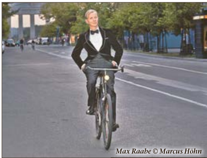
Max Raabe

Im Originalrepertoire der 20er Jahre sind weitere Nachtgeschichten entdeckt worden, die in „Eine Nacht in Berlin“ un-nachahmlich zu Gehör gebracht werden. Was es mit der Unvernunft auf sich hat, das erzählt Max Raabe in seinem neuen Hit „Du passt auf mich auf“. Alles ist verbunden durch Leichtigkeit, Erlesenheit und Ironie - und durch die pointierte Moderation von Max Raabe. „Eine Nacht in Berlin“ ist die beste Therapie gegen die Sorgen-falten des Alltags! Karten gibt es noch: - in der Tourist-Information im CCS (Tel. 03681/788-228 oder -405), - an allen bekannten VVKStellen in Suhl und der Region, - bei CTS (Tel. 01806/570070; 20 ct / Anruf a. d. dt. Festnetz, max. 60 ct / Anruf a. d. dt. Mobilfunknetz) und allen angeschlossenen VVK-Stellen sowie - im Internet unter www.eventim.de , http://www.lesershop-online.de/ und www.konzertbuero-augsburg.de