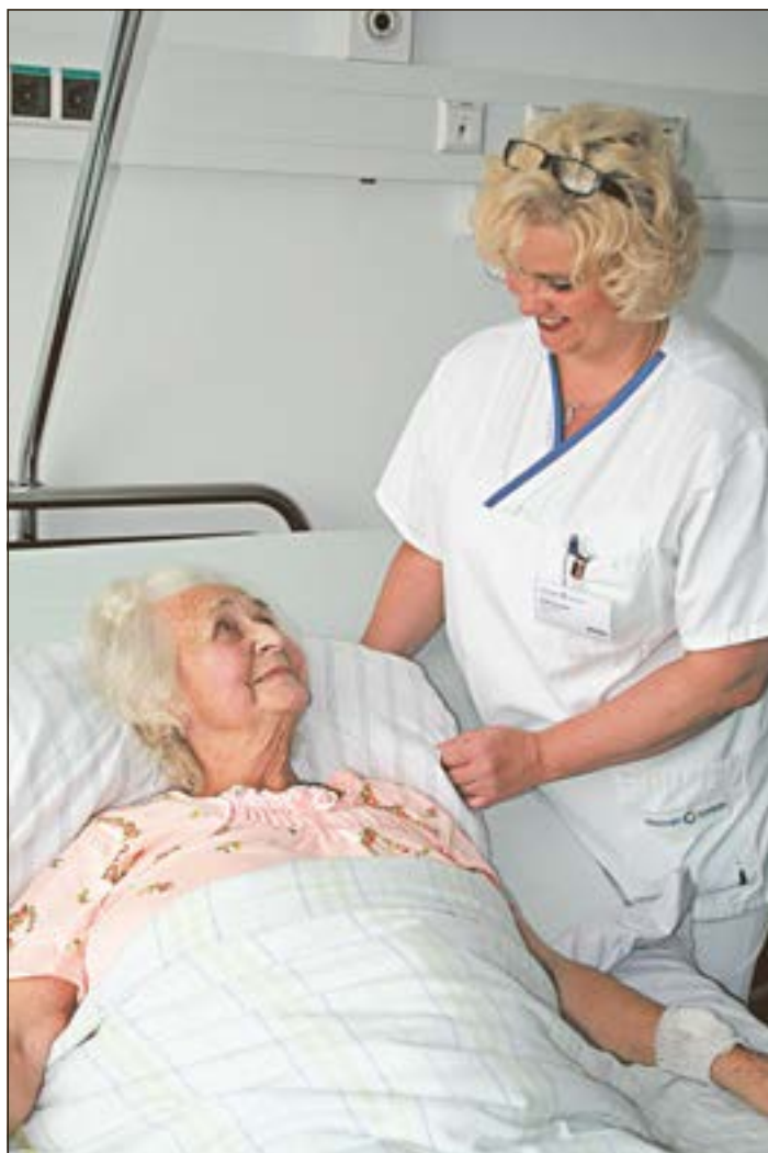
Individuelle Fürsorge wird in der Klinik Neustadt groß geschrieben.