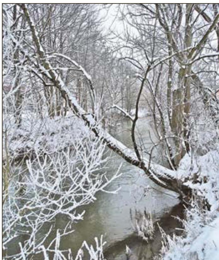
Die Werra an der Marderwiese in Hildburghausen.

Hinter dem Christkind stehen zwei Ochsen, ein Esel, ein Nilpferd und ein Brontosaurier. Das Nilpferd und den Saurier habe ich hinein gestellt, weil die Ochsen und der Esel waren mir allein zu langweilig. Links neben dem Stall kommen gerade die heiligen drei Könige daher. Ein König ist dem Papa im letzten Advent beim Putzen herunter gefallen und er war total hin-