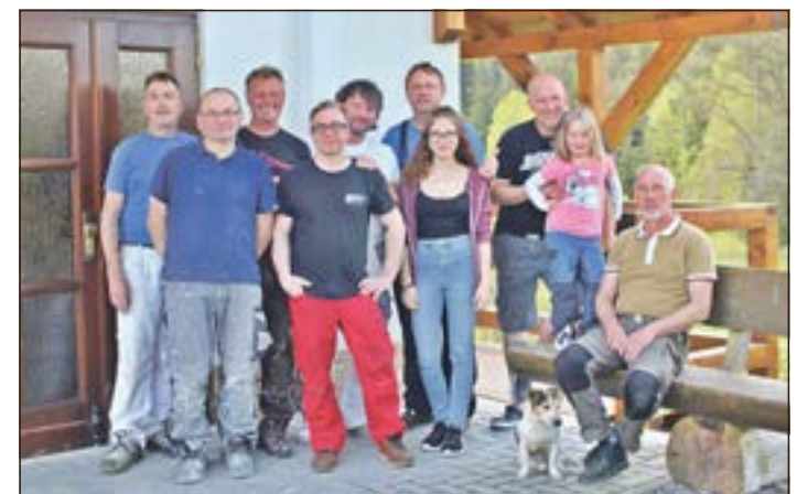
Die fleißigen Helfer aus Gerhardtsgereuth.