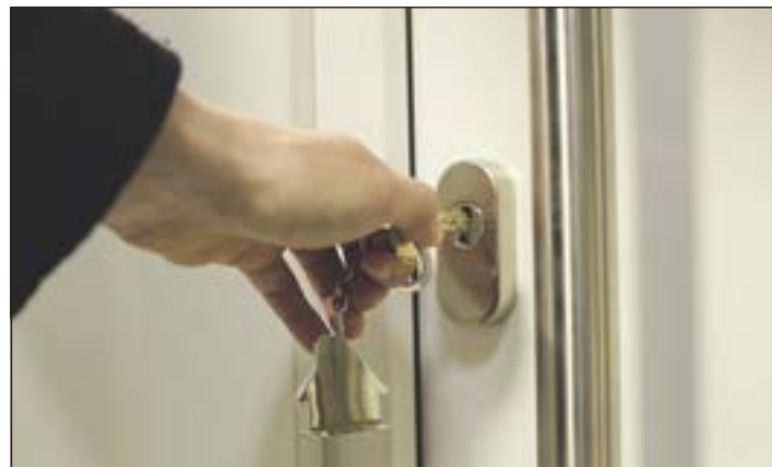
Das Schlüssel-Schloss-Prinzip für die eigenen vier Wände: Wer ein Haus bauen oder eine Eigentumswohnung kaufen will, braucht gute Bedingungen für eine solide Finanzierung.

Die eigenen vier Wände im Kreis Hildburghausen: 25- bis 40-Jährige sind „Verlierer-Generation“