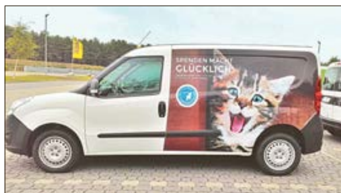
Der neue Tierhilfswagen des Tierschutzvereins Südthüringen e. V.

Hildburghausen. Eine besondere Überraschung hat der Tierschutzverein Südthüringen e. V. vom Deutschen Tierschutzbund erhalten: Der Dachverband übergab dem Verein einen Tierhilfswagen, der die tägliche Tierschutzarbeit erleichtern soll. Zum Einsatz kommen soll das neue Fahrzeug der Marke Opel Combo für Tierrettungen, tägliche Fahrten zum Tierarzt, den obligatorischen Transport von Futtermitteln und allem anderen, was das Tierheim tagtäglich benötigt. Das Auto ist auffällig bedruckt: auf der einen Seite mit einem Motiv des Haustierregisters des Deutschen Tierschutzbundes und auf der anderen Seite mit einem Katzenmotiv mit Spendenaufwurf.