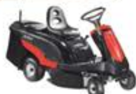
ZEPHIR 72/12,5 KH 3in1

Leistung: 6,51 kW - 2.800 U/min Schnittbreite: 72 cm