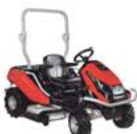
TONKAWA 26 Kawa

Leistung: 16kW - 2.900 U/min Schnittbreite: 110 cm Differentialsperre Allrad