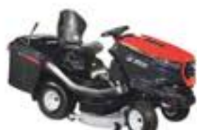
EF 106/24 KH

Leistung: 12,3kW - 2.800 U/min Schnittbreite: 102 cm