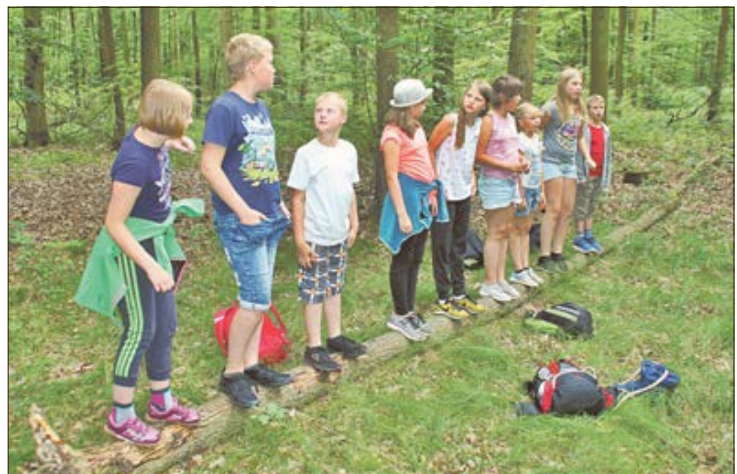
Die Ferienkinder im Stadtwald.