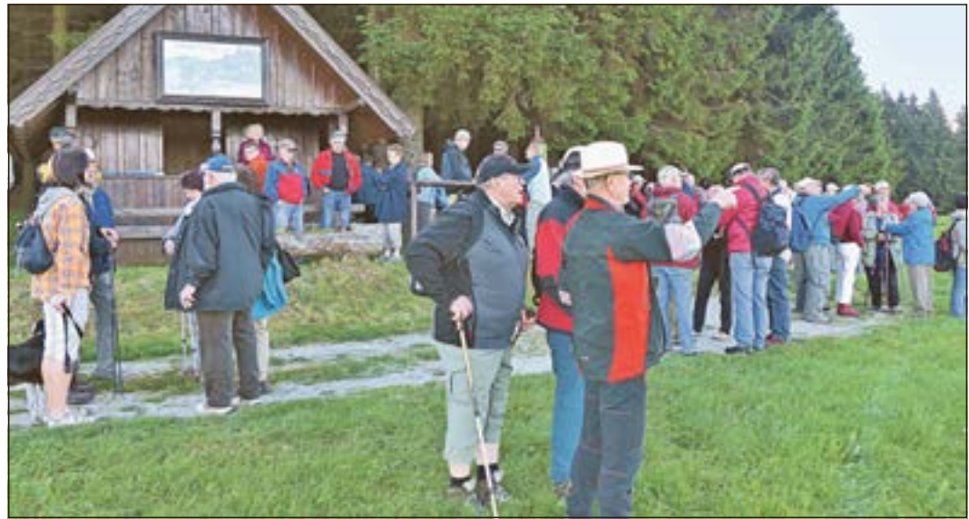
Impressionen vom 17. Wander- und Hüttentag.