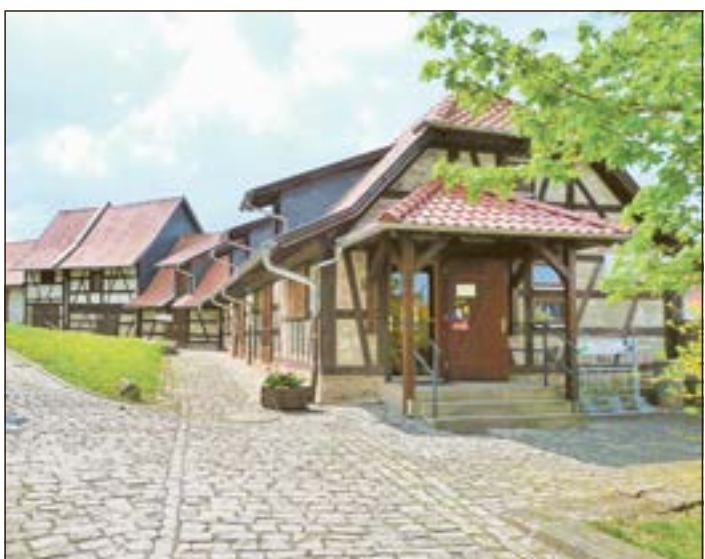
Streufdorf. Im Zweiländermuseum Rodachtal (s. Foto) ist noch bis 29. Juli 2018 die aktuelle Sonderausstellung „Hutelandschaften und Grünes Band - Lichtblicke für die Natur?“ zu besichtigen. Die Hutelandschaften mit Heckrindern und Konikpferden sowie das Grüne Band sind Rückzugsraum für Pflanzen und Tiere, die Ruhe und Ungestörtheit brauchen. In der Ausstellung zeigt das Museum zu seinen Öffnungszeiten, wie vielfältig sich dieser Lebensraum entwickelt hat und wer in diesem lebt.

Straufhain. Von Donnerstag, dem 5. bis Sonntag, dem 8. Juli 2018 wird in Streufdorf das 22. Fußballturnier um den Pokal des Bürgermeisters der Gemeinde Straufhain ausgetragen. Nachfolgender Ablauf ist geplant: - Donnerstag, 5. Juli 2018, 18 Uhr und 19.15 Uhr: jeweils eine Vorrundenbegegnung, - Freitag, 6. Juli 2018, 18 Uhr und 19.15 Uhr: jeweils eine Vorrundenbegegnung. Die Auslosung der beiden Halbfinals erfolgt unmittelbar nach dem letzten Vorrundenspiel am Freitagabend gegen 20.30 Uhr! - Samstag, 7. Juli 2018: 17 Uhr: 1. Halbfinale; 18.30 Uhr: 2. Halbfinale. Unmittelbar nach dem 2. Halbfinale wird der 3. Platz im Entscheidungsschießen ermittelt! - Sonntag, 8. Juli 2018, 14 Uhr: Spiel der AH-Mannschaft der SG Straufhain; 16 Uhr: Finale (kurzfristige Änderungen vorbehalten!) Gespielt wird auf Großfeld auf dem Sportplatz „Am Holzberg“ in Streufdorf, jeweils 2 x 30 Minuten im K.O.-System Für das leibliche Wohl ist wie jedes Jahr bestens gesorgt! Mit sportlichem Gruß Der Vorstand des LSV Streufdorf 1990 e.V.