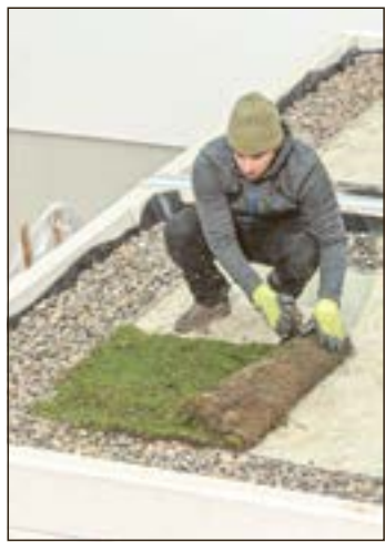
Der mehrschichtige Aufbau sorgt für Dichtigkeit und Langlebigkeit des Gründachs.

(rgz/rae). Viele Flachdächer von Eigenheimen und Garagen eignen sich für eine Begrünung, direkt beim Neubau ebenso wie nachträglich. Erfahrene Heimwerker können in Eigenregie ein Gründach anlegen und damit zu einem verbesserten Mikroklima in ihrem Stadtviertel beitragen. Durch eine Dachbegrünung etwa mit dem Urbanscape-System von Knauf lässt sich aber auch die Energieeffizienz des Eigenheims verbessern. Bis zu 25 Prozent der Heizkosten und 75 Prozent des Aufwandes für Kühlung oder Klimatisierung können eingespart werden. An heißen Sommertagen ist das Zuhause besser vor einer Überhitzung geschützt, zugleich verbessert sich der Schallschutz. Details, Verlegevideos und Tipps zur Verarbeitung: www.knauf.de/urbanscape