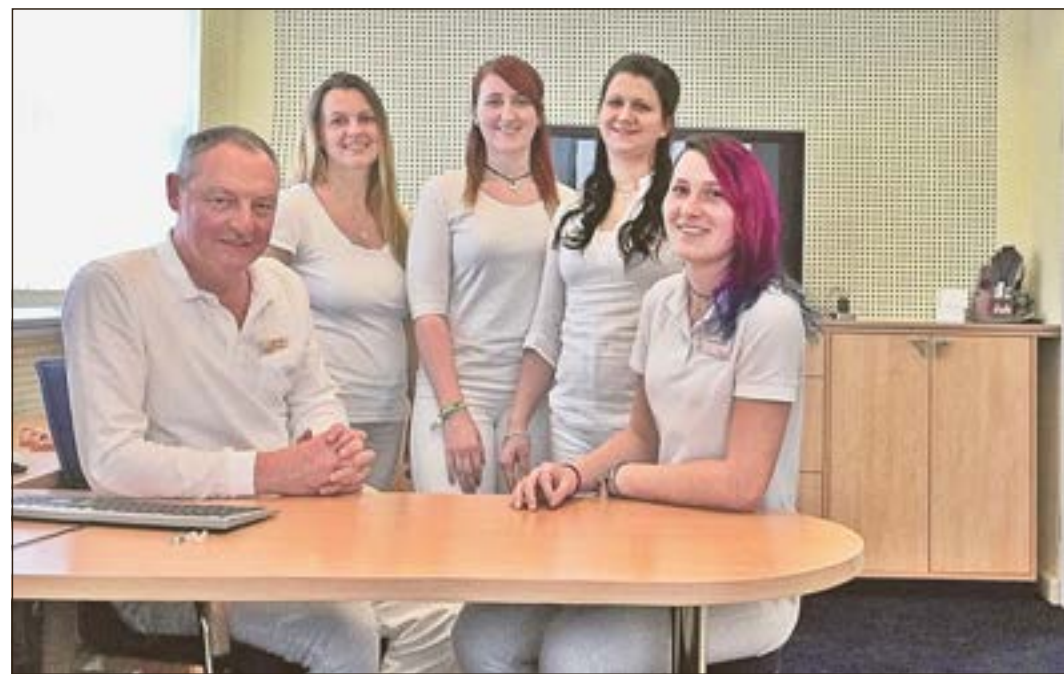
Das Team des terzo-Zentrums Hildburghausen.

Entschlossenheit zum Wohle der Stadt ist etwas anderes, als Entschlossenheit zum Machterhalt.