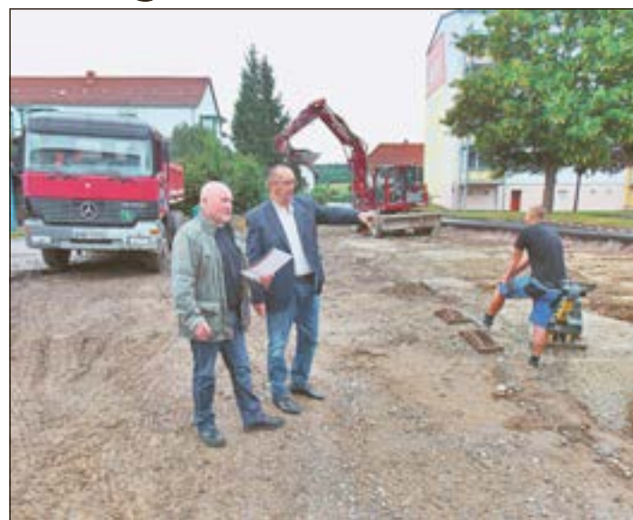
Langsam nehmen die Freianlagen mit Grünfläche, Stellplätzen, Sitzbereichen und Abstellmöglichkeiten für Wertstoffe und Restmüll Gestalt an.