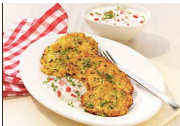
Schnittlauch-Reibekuchen mit Kresse-Tomatendip.

Pro Portion: kJ/kcal: 1411/338 EW: 7,1 g F: 14,8 g KH: 43,8 g BE: 4