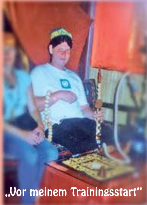
„Vor meinem Trainingsstart“

Sport gehört inzwischen für mich zum täglichen Leben dazu wie das Zähneputzen.